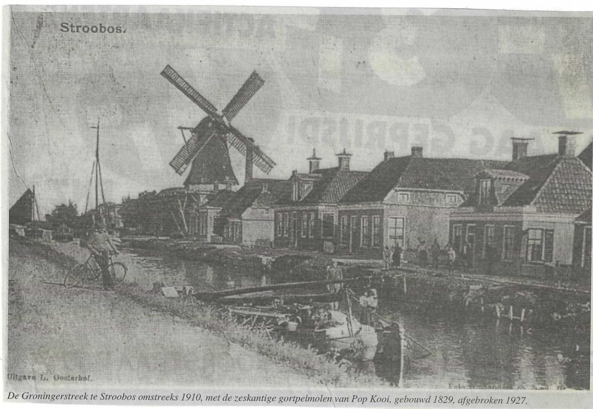
Ullgava L. Oosterhof.

DIT WAS EEN PUBLICATIE NAMENS DE STICHTING OUD-ACHTKARPELEN